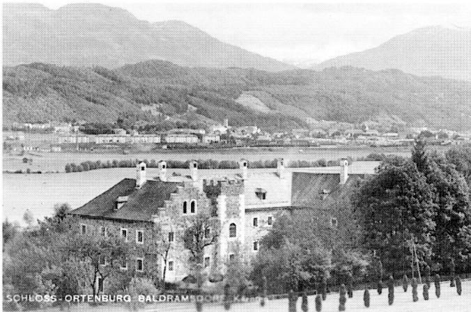
„Schloß Ortenburg - Baldramsdorf in Kärnten“ Eine Bildpostkarte, die wahrscheinlich in den 30er Jahren aufgelegt wurde.

Von den Kindern des bereits verstorbenen Ehepaars Alber-Glanstätten wurde 1926 der gesamte Besitz in Unterhaus verkauft.