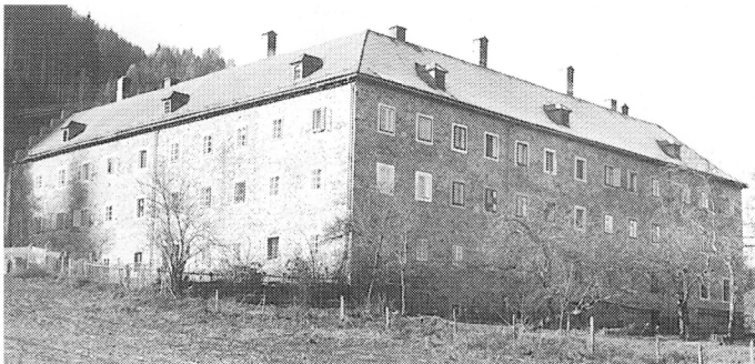
Die Nord-Ost-Seite des Schlosses im Jahre 1970

Manche der Bewohner errichten sich im Laufe der Jahre ein Eigenheim in Baldramsdorf oder zogen in neu errichtete Wohnungen, wodurch Räume im Schloß leer wurden.